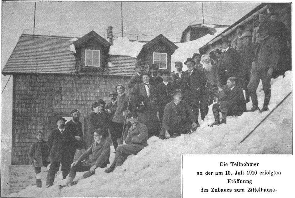
Die Teilnehmer an der am 10. Juli 1910 erfolgten Eröffnung des Zubaus zum Zittelhause.

Durch den erwähnten Brand eines Waggons Einrichtungsstücke entstanden auch Mehrkosten, es mußte aber auch die Eröffnung des Hauses auf das Jahr 1910 verschoben werden.