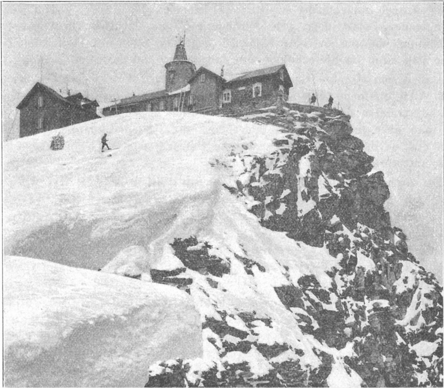
Ansicht des Zittelhauses auf dem Hohen Sonnblick nach dem Zubau.

Kurz nach Vollendung des Zubaues auf der Westseite des Turmes am Hohen Sonnblick im Jahre 1888, nahm die Besucherzahl des Zittelhauses im Laufe der Sommer ganz erheblich zu. Es machte sich schon zur Zeit als Peter Lechner noch Beobachter und Wirtschafter war, das Bedürfnis nach Erweiterung des Hauses geltend und schon damals wurde von einem Zubau auf der Südseite des bestehenden Hauses gesprochen. Viele Jahre mußten vergehen, bis es der Sektion Salzburg des Deutschen und Österreichischen Alpenvereines, der Besitzerin des Hauses, möglich wurde, den jahrelang in Beratung stehenden Plan einer Vergrößerung des Hauses zur Ausführung zu bringen. Es mußte dazu eine Sub-