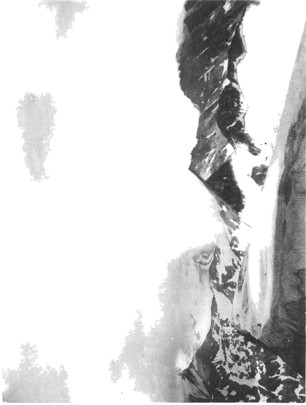
Wolkenbank über dem Tauernkamm bei S. W.-Wind. Mitte.