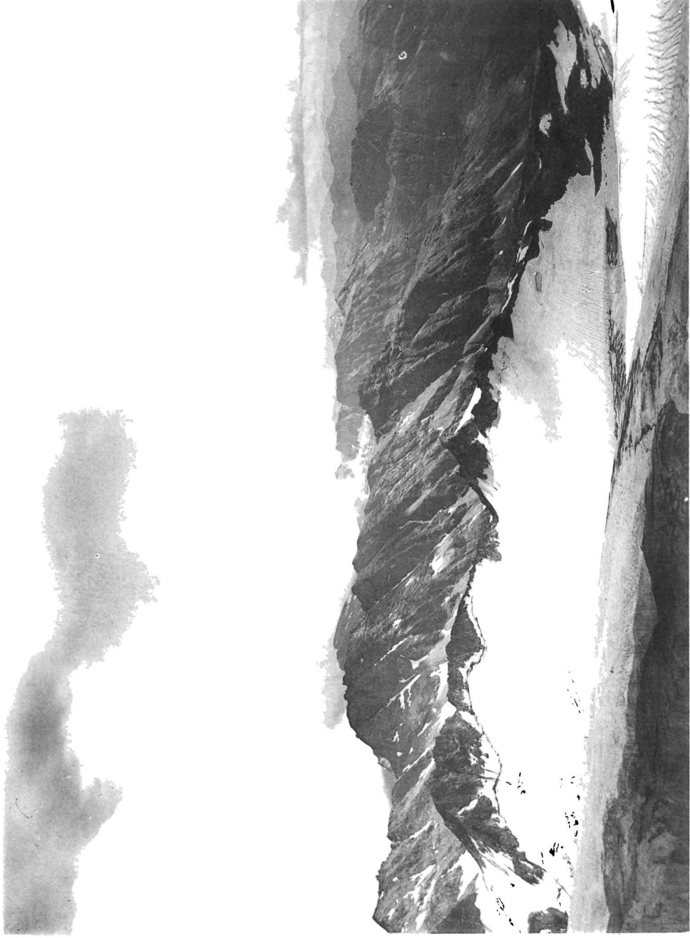
Wolkenbank über dem Tauernkammer bei S. W.-Wind. S. W.-Ende.