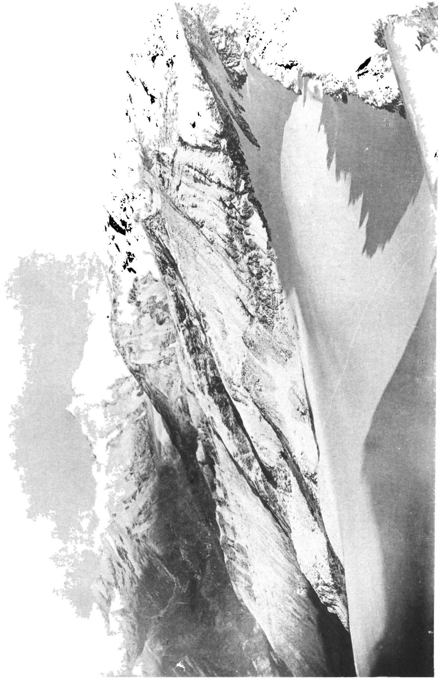
Die Glocknergruppe bei Neuschnee.