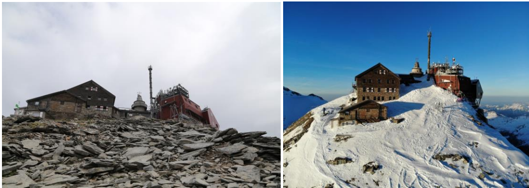
Sonnblick Observatorium: Links: Sommer. Rechts: Frühjahr